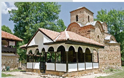
Манастир Свети Јован Богослов