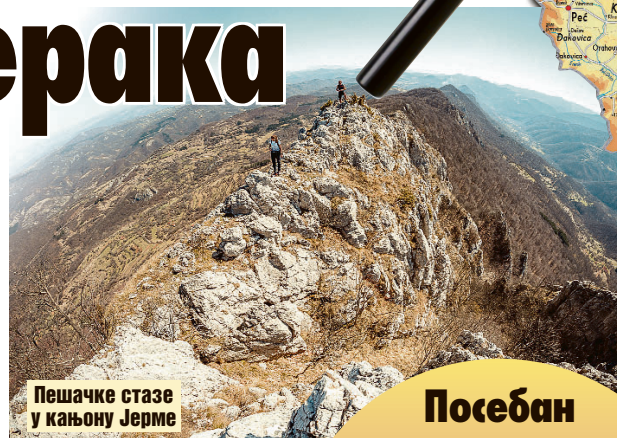
Пешачке стазе у кањону Јерме