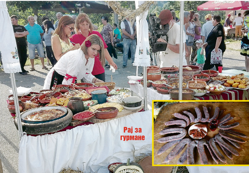
Рај за гурмане